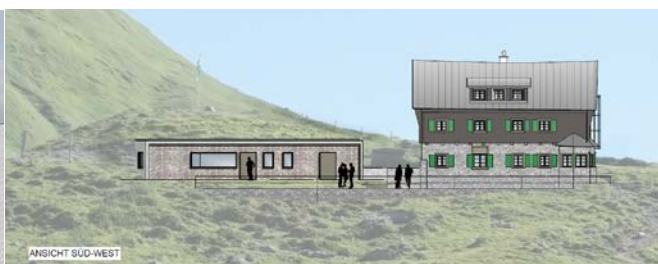
Entwurf Sanierung mit Erweiterungsbau der Anhalter Hütte, Stand Januar 2018, Architekturbüro Birkel