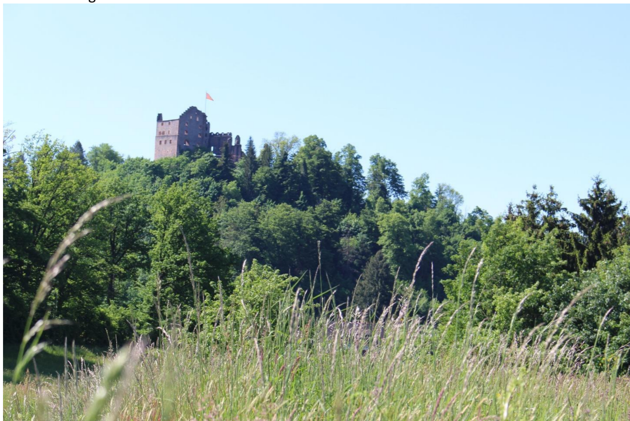
Vorbei an der Ruine Geroldseck