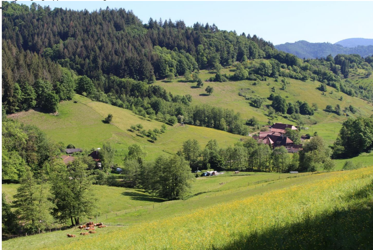
Erster Anstieg durch den Erzenbach