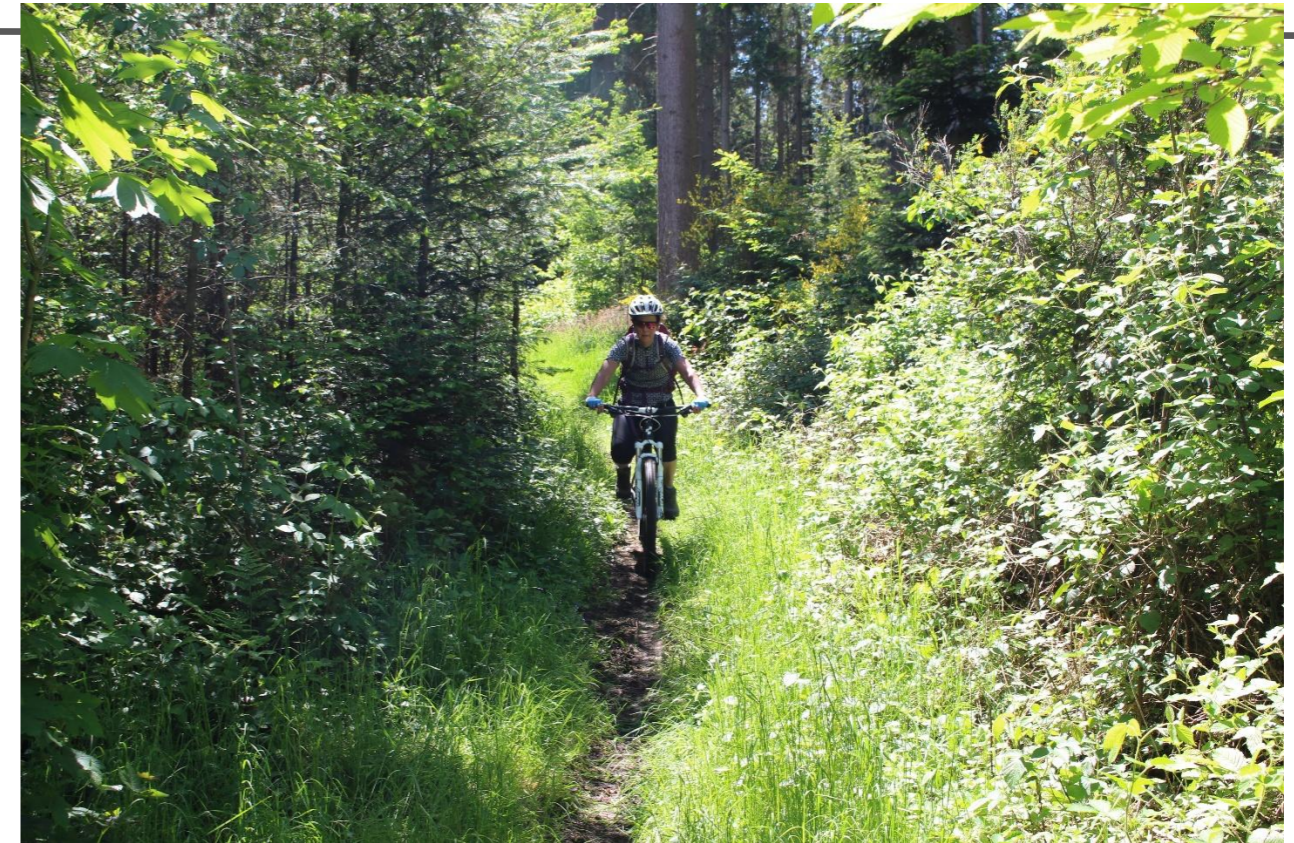
Trailabfahrt über den letzten Höhenrücken