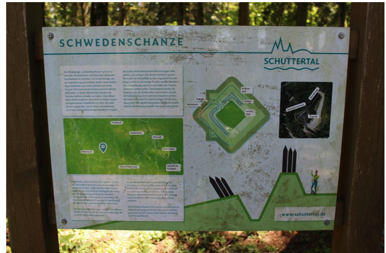
„Auf der Schanz“, alte Befestigungsanlagen